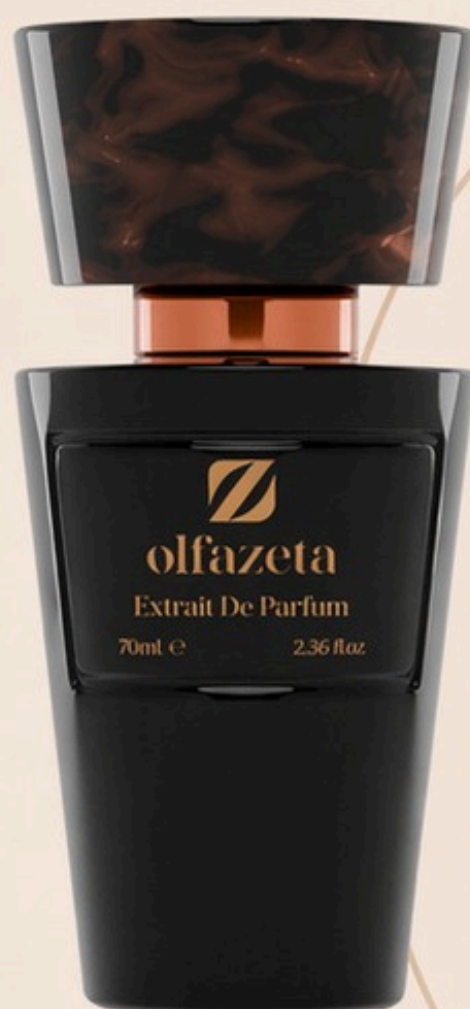
Flacon en 70 ml