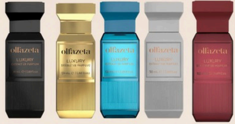
flacon en 50 ml